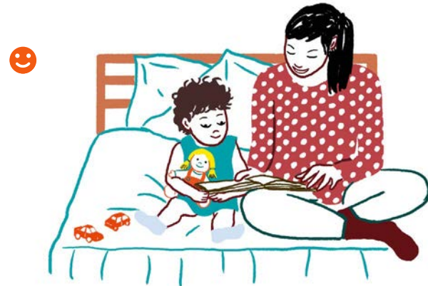
Avant de dormir