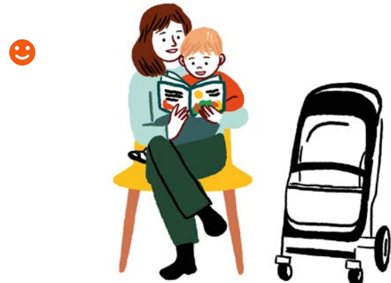
Avant un rendez-vous